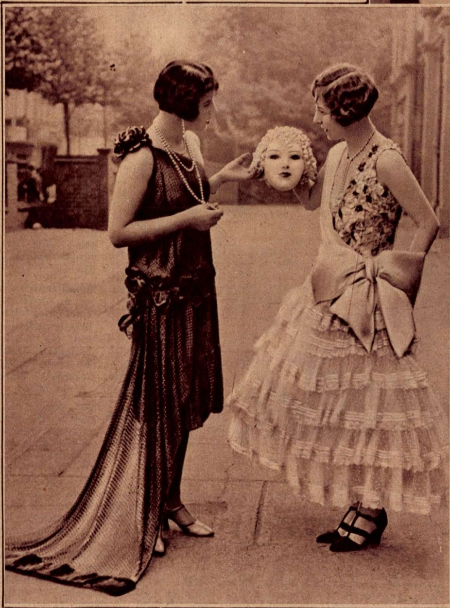
Két párisi próbakisasszony a styli ruhához komponált álarcral

mozgásúak, hanem szépek is legyenek. Ezzel elérték azt, hogy az összbemutató kedvezőbb volt, azonban két nagyon fontos veszéllyel járt ez a rendszer. Először is a próbakisasszony arcának szépsége nagyon gyakran elterelte a figyelmet a ruháról, másodszer pedig a toalettek kreálói kénytelenek voltak számolni a próbakisasszony szépségének fokával és stílusával, amellyel összhangba kellett hozni a ruhát. De hátrányos volt ez a rendszer még azért is, mert nagyon sok pompás alakú nő van, akinek nincs olyan szép arca, mint a próbakisasszonyok átlagának, ezeket azután semmiképpen sem lehetett felhasználni.